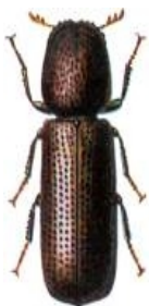
Kleine graanboorder Rhizopertha dominica

bruin tot zwart 3-5 mm lang heeft knotsvormige, geknikte antennen een "olifantssnuit"