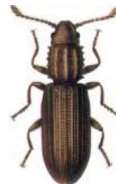
Getande graankever Oryzaephilus surinamensis

kastanjebruin 4-6 mm lang het mannetje heeft twee uitgegroeide kaken, die lijken op hoorns