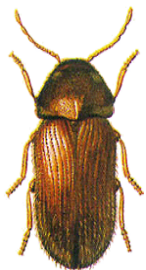
Broodkever Stegobium paniceum

roodbruin 2-4 mm lang ovaal van vorm heeft ver uitstekende antennes