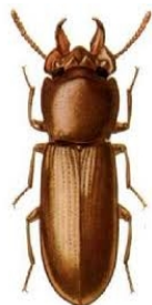
Gehoornde meelkever Gnatocerus cornutus

roodbruin 2-4 mm lang ovaal van vorm heeft ver uitstekende antennes