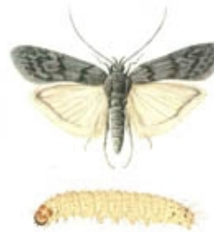
Grauwe meelmot Ephestia kuehniella

13-19 mm spanwijdte 6-9 mm lang voorvleugels zijn gelig tot geelbruin de achtervleugels zijn grijs de achterste randen van de voor- en achtervleugels hebben lange franjes zeldzaam!